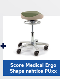
Score Medical Ergo Shape nahtlos PUxx

Der Score Collum Dysphagio ist ein Score Produkt.